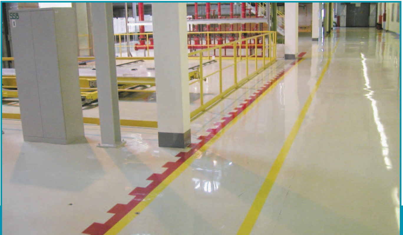
Ordnung und Sicherheit dank farbiger ROMEX® - Industrieböden Order and safety thanks to coloured ROMEX® Industrial flooring Порядок и надежность благодаря цветным промышленным полам ROMEX®

Ausgewählte Farben, in unserem Fall zum Beispiel für fertige Böden und Wände in der Arbeitswelt der Industrie, stimulieren den arbeitenden Menschen positiv. Die umseitigen Farben wurden unter diesem Aspekt für Sie zusammengestellt.