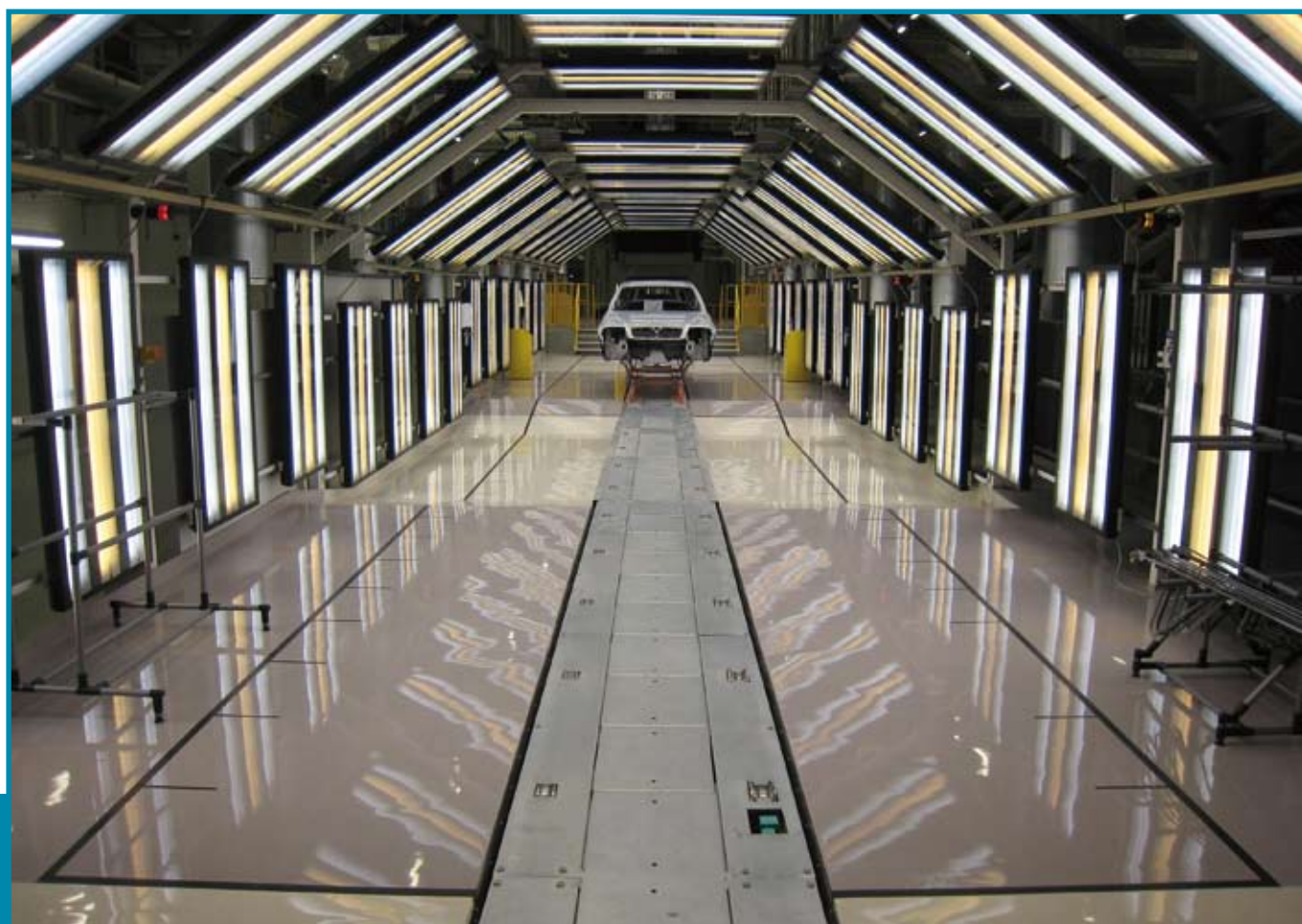
Stahlbühnenbeschichtung für DÜRR im Paintshop-Endkontrolltunnel bei VW in Kaluga/Russland • Покрытие для стальной платформы для фирмы DÜRR в туннеле конечного контроля в лакокрасочном цехе на заводе VW в Калуге/Россия • Steel platform coating for DÜRR in the Paintshop Final Control Tunnel at VW in Kaluga/Russia