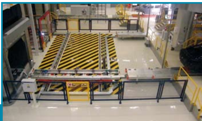
Logistik- und Transportbereich mit ROMEX® Markierungen • Зона логистики и транспорта с разметкой ROMEX® • Logistics and Transport areas with ROMEX® markings